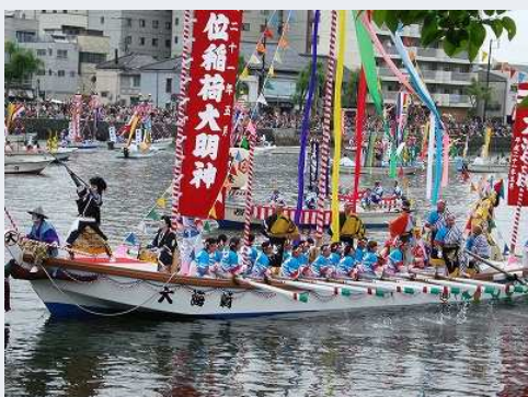
日本三大船神事「ホーランエンヤ」