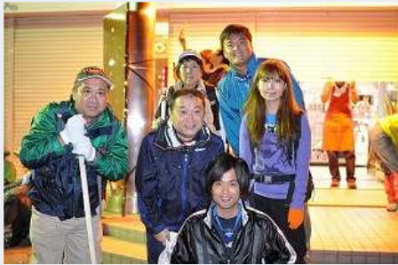
富士山五合目-出発前で皆元気