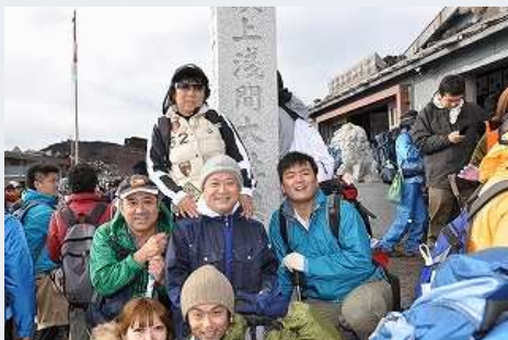
富士山頂上で記念撮影-頭痛が...