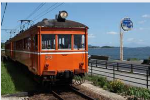
宍道湖沿いを走る一畑電車デハ二 映画「Railways」