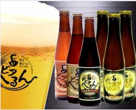
松江地ビールピアへるん