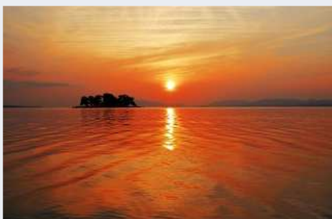
宍道湖の夕日(島根県松江市)