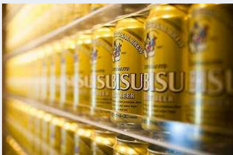
サッポロビール 千葉工場